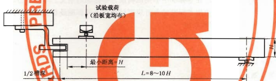
图 1 侧面开槽试件